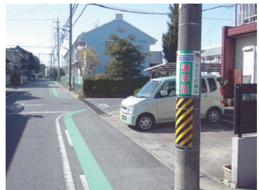
豊田市青木町に設置した「通学路」表示板(1)

通行車両に対し通学路であることをしっかりと認識させることで、この対策効果を更に高いものにできるよう、当協会オリジナルデザインの「みどりの線は通学路」表示板寄贈を提案させていただきました。現在みどりの線が設置してある箇所へ合計20枚の表示板を施工寄付させていただきました。