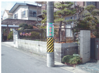
豊田市青木町に設置した「通学路」表示板(2)