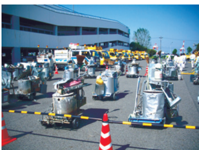
整然と並んだ施工器具