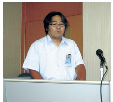
講師の栗木主査様