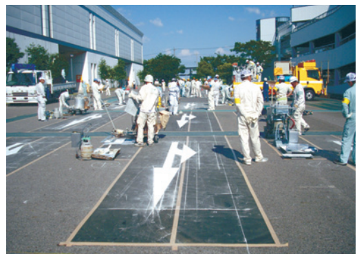
課題は矢印の施工

当協会は路面標示工事に対して、能力を有する多くの路面標示技能士が所属している事業者の団体です。