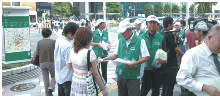
秋の交通安全県民運動における啓発グッズ配布の様子