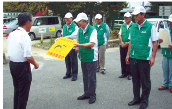
みよし市下児童館へ「不審者警戒」表示板を贈呈

当日は三好上、下両行政区にある児童館にて贈呈から設置までを子供たちといっしょに行いました。このボランティアのコンセプトは子供たちを犯罪から守ることであり、表示板設置による犯罪抑止効果のみならず、地域の方々に対する啓蒙にもお役立ていただけるものと考えて発案いたしました。