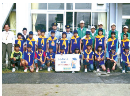
知立市猿渡小学校/H22.9.28