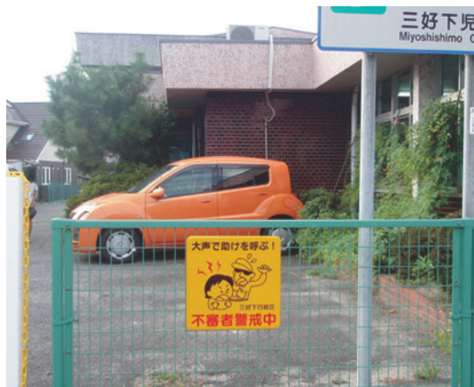
「三好下児童館」に設置した表示板