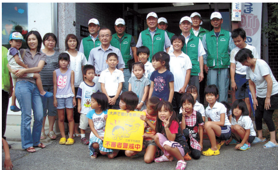
設置作業をする前に、児童館の子どもたちと記念撮影