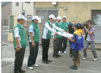
啓発シートの贈呈