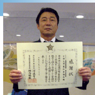
交通安全功労者団体表彰をいただきました

これらの交通安全活動について高く評価され（財）愛知県交通安全協会様より当協会として交通安全功労者団体の表彰を受けることが出来ました。これにおごることなく今後も協会員一丸となって交通安全事業委員会を中心に活動を続けていきたいと思っております。