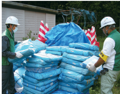
提供された保安機材