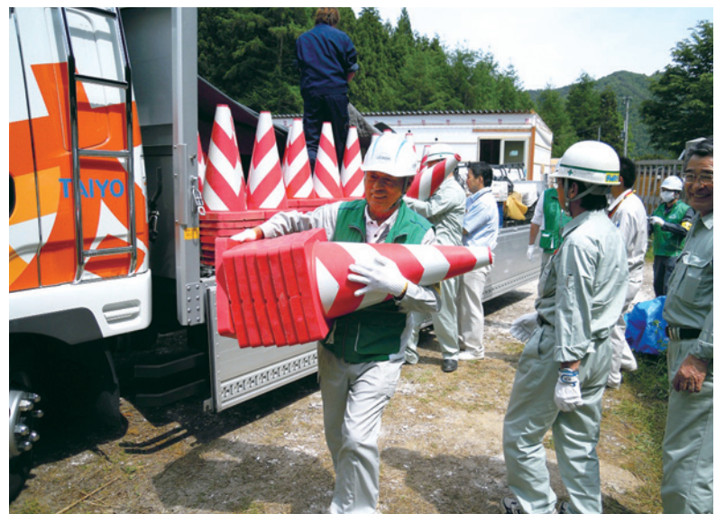
寄贈保安機材の積み下ろしの様子