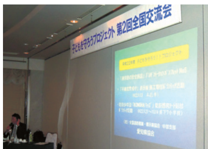
愛知県境会の発表の様子

愛知県・静岡県・群馬県・岐阜県・石川県の各協会からは、各対象小学校のスクールゾーンの安全診断やカラー標示、防護柵等の施工寄付などの平成22年度の活発な活動報告があり、このプロジェクトが全国的に着実に進展していることを嬉しく思いました。次回(第3回)の開催は群馬県を予定し、未来を担う子どもたちの安全を願い更に努力することを誓って閉会いたしました。