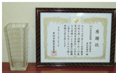
豊田市教育委員会様よりいただいた感謝状と記念品

これに対し、教育委員会様より感謝状と記念品の授与をいただきましたことは、誠に栄誉の極みでありました。