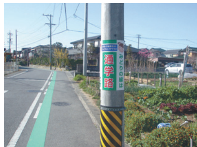
豊田市青木町に設置した「通学路」表示板(3)