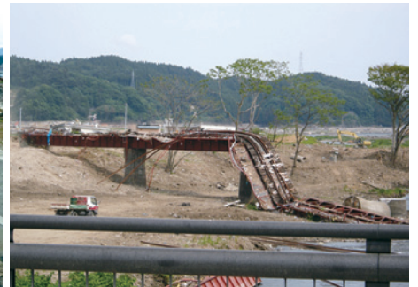
逆流した津波で流された鉄道橋