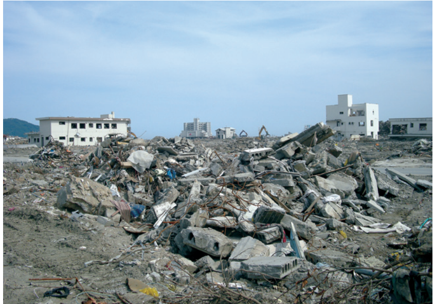
言葉を失うほどの被災状況(岩手県陸前高田市市街地)

今後も保安機材の補充を進めるとともに、愛知県新城市総合防災訓練や各地域防災訓練を通じ、当地における災害に備えてまいりたいと存じます。