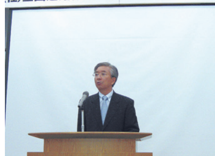
「子どもを守ろうPJ」の提案をする前山会長