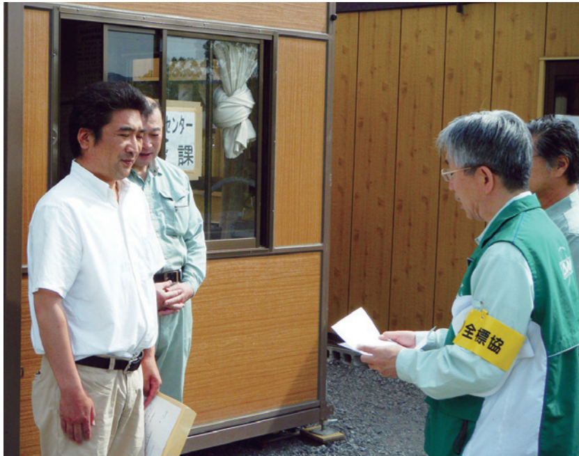
陸前高田市の建築課へ寄贈保安機材の目録を贈呈