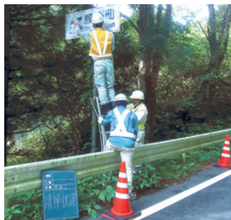
標識の清掃ボランティア