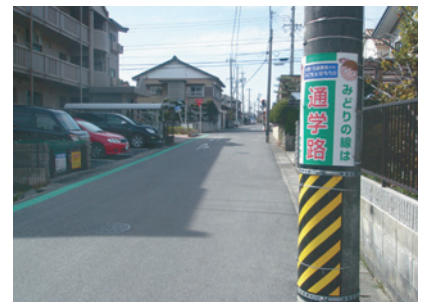
豊田市青木町に設置した「通学路」表示板(4)