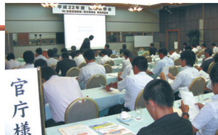
各官公庁の担当者と意見交換できる貴重な研修会

私共(社)全標協愛知県協会では、各専門部会における技術の向上を目的とした技術研修会を開催しております。今年で4回目を数える当研修会には毎回、各官公庁より御担当者をお招きし、専門技術のプレゼンテーションや公益性の高い活動報告などを発表し、それらに対する質疑応答など活発な意見交換がなされ、大変充実したものとなっております。