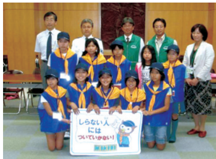
中川区常盤小学校/H22.10.4