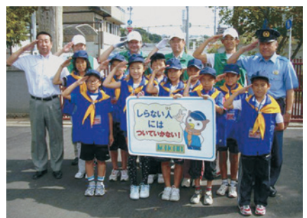
岡崎市広幡小学校/H22.9.29