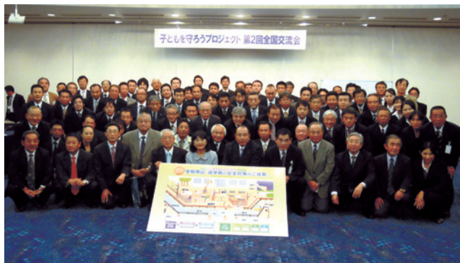
「子どもを守ろうプロジェクト」第2回全国交流会は総勢102名の参加者

平成22年11月12日(金)「子どもを守ろうプロジェクト」の第2回全国交流会が、焼津黒潮温泉ホテル アンピア松風閣において開催されました。昨年石川県金沢市で開催されました第1回全国交流会には全国より60名の参加者がありましたが、今回は静岡県、群馬県、東京都、神奈川県、新潟県、石川県、三重県、岐阜県、兵庫県、広島県、香川県、愛知県の12都県協会より88名、地元の来賓14名計102名もの参加があり大盛会となりました。