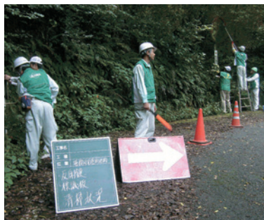
アリネーターの清掃ボランティア

本年度も10月2日から10月7日までの間、会員47社が参加のもと県下9建設事務所管内においてカーブミラー及び路側標識の清掃、点検ボランティアを実施いたしました。建設事務所担当者様と事前協議を行いご希望や指定路線を伺いながら進めてまいりました。当日は担当幹事を中心として安全ミーティングを実施し3～4名1組になり安全第一で作業を行ないました。