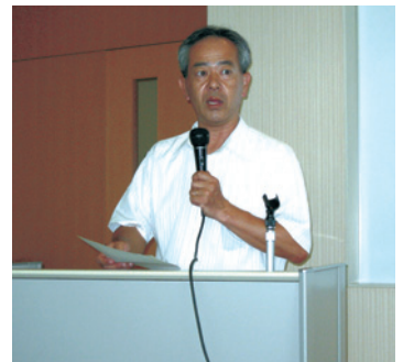
講師の狩谷主任主査様