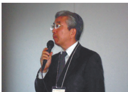
交流会事務局(愛知県)前山会長挨拶