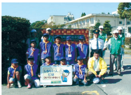
阿久比町英比小学校/H22.10.1