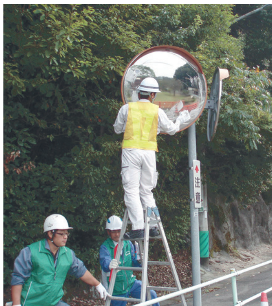
反射鏡の清掃ボランティア