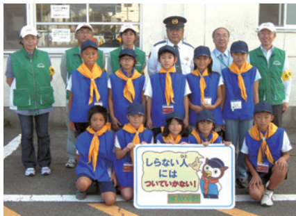
豊橋市向山小学校/H22.10.8