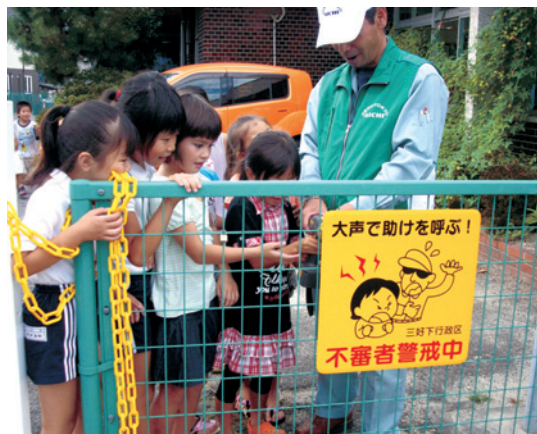
子どもたちと共に取り付け