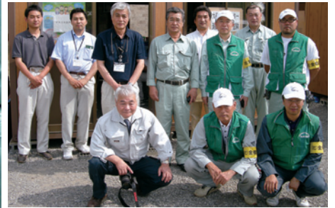
陸前高田市役所、岩手協会の皆さんと