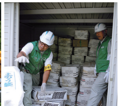
寄贈保安機材の積み下ろしの様子