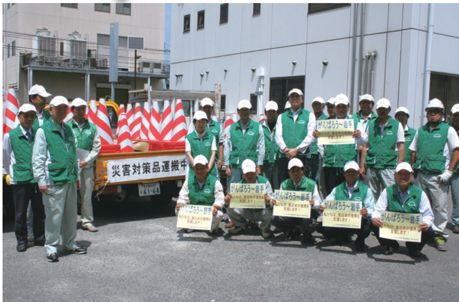
県下11基地の保安機材を集結。陸前高田市へ。