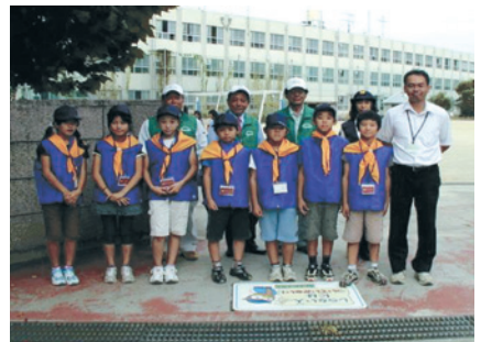
名東区藤が丘小学校/H22.10.14